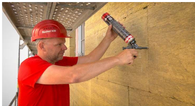
3, Vyplnění expanzní hmotou SanRec 750