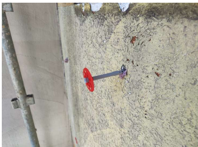
3, Vložení do pěny rámové kotvy SXRL-T