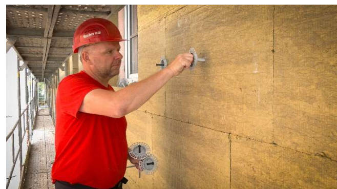
4, Vložení talířové hmoždinky TermoZ CS II 8