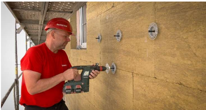
5, Aplikace pomocí montážního přípravku Termoz CS