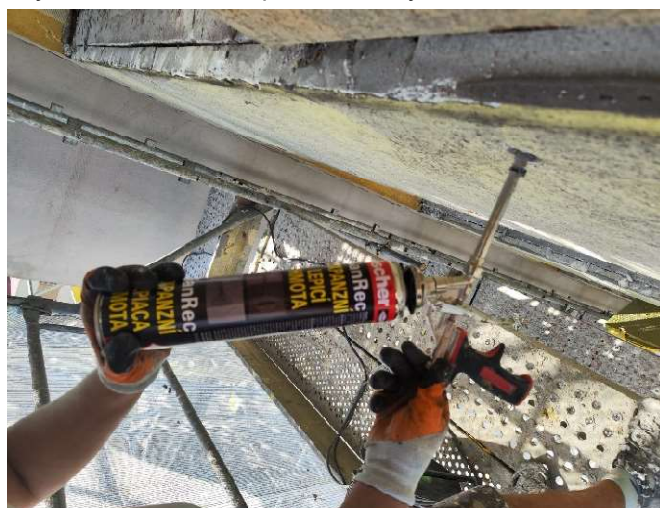
2, Vyvrtání a vložení expanzní hmoty SanRec 750