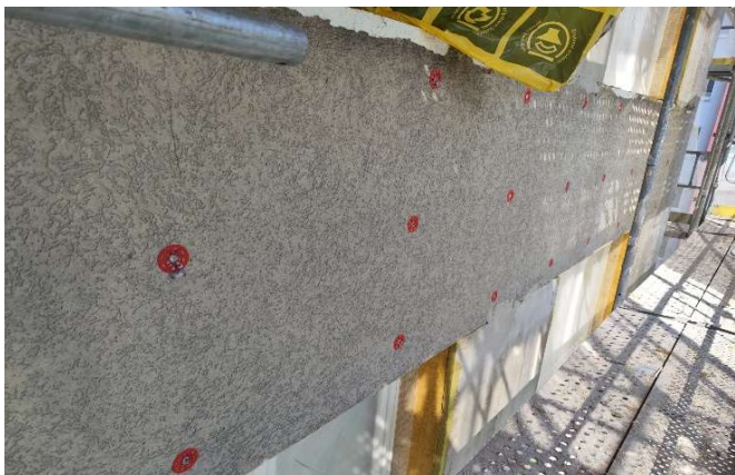
7, Rastr kotvení SXRL-T ve starém ETICS 0,75m x 0,75m