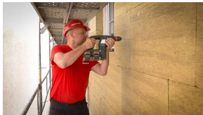
2, Vyvtření díry pro talířovou hmoždinku TermoZ CS II 8