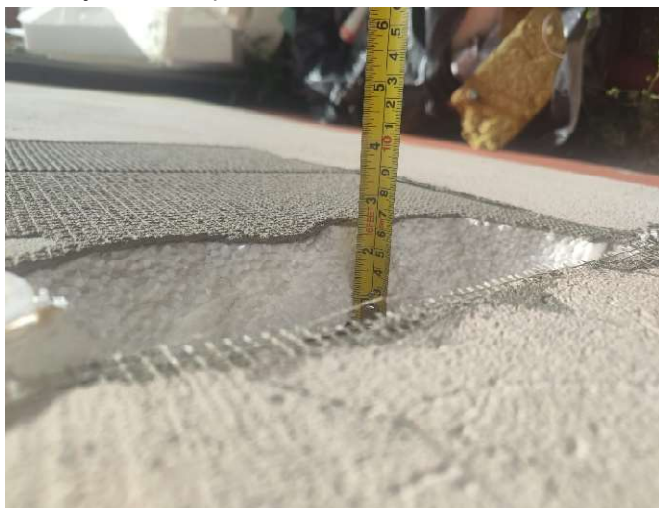
1, Stávající ETICS před kotvením SXRL