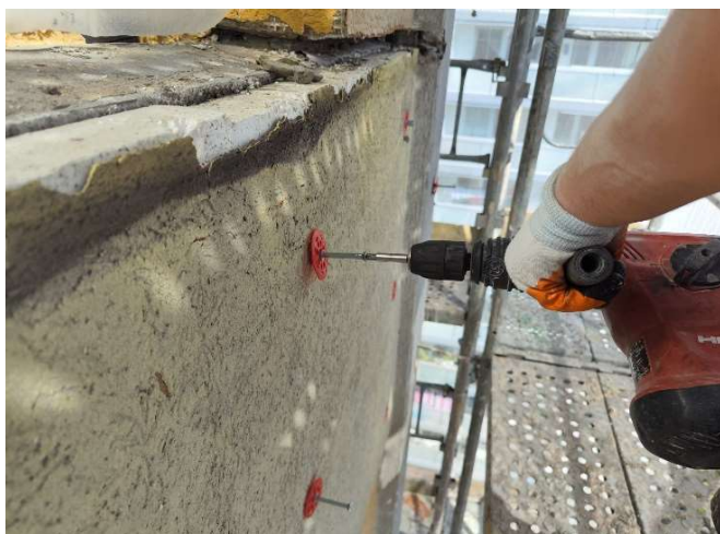
5, Utažení SXRL-T do starého SXRL-T