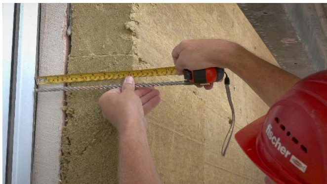
1, změření celkového souvrství