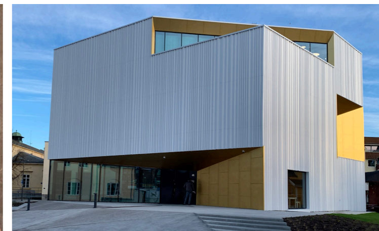
Prosjekt: NITJA - Akerhus Kunstsenter, Lillestrøm Blikkenslager: Franke Onsrud Blikkslageri AS Produkt: AluColour® PVDF RAL9010 PureWhite 0,9 mm, Spesialknekt profil