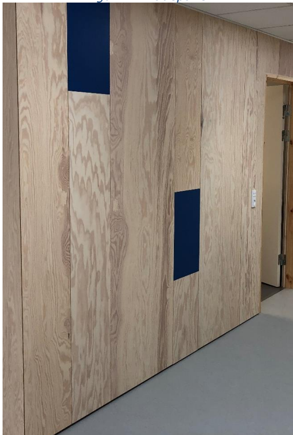
Figur 1 - Pladepanel