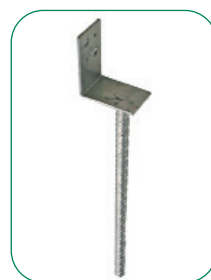
L-profil 75x400 Varmforzinket PN nr. 659600107