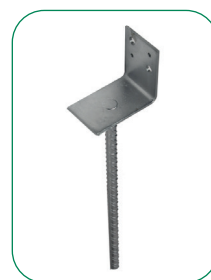
L-profil 101x400 Varmforzinket PN nr. 659700107